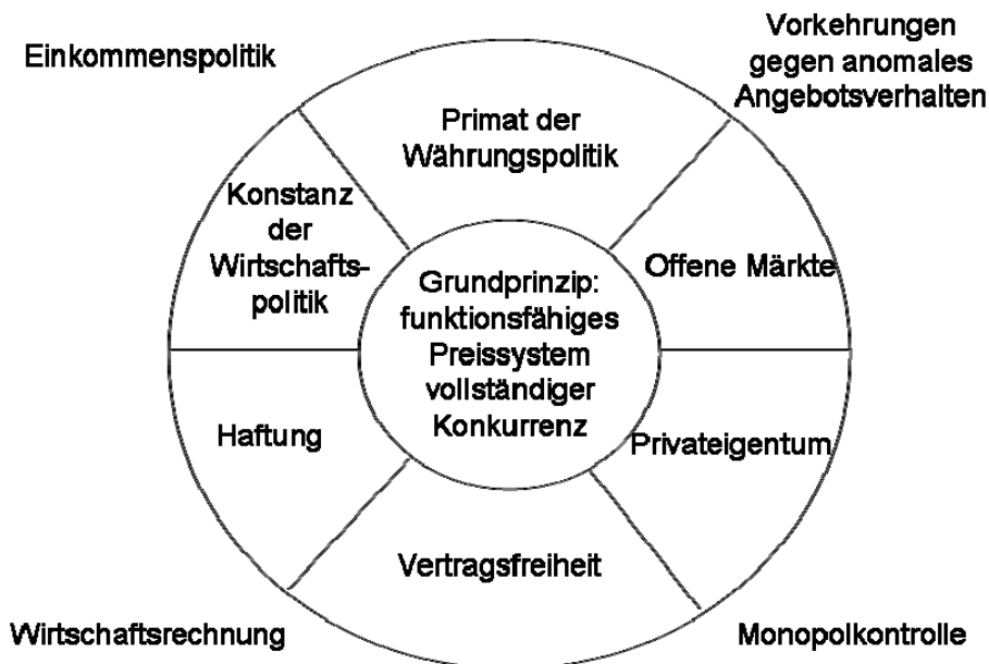
Abb. 2. Euckens konstituierende und regulierende Prinzipien

Quelle: Eigene Darstellung in Anlehnung an: Goldschmidt (2008), S. 195.