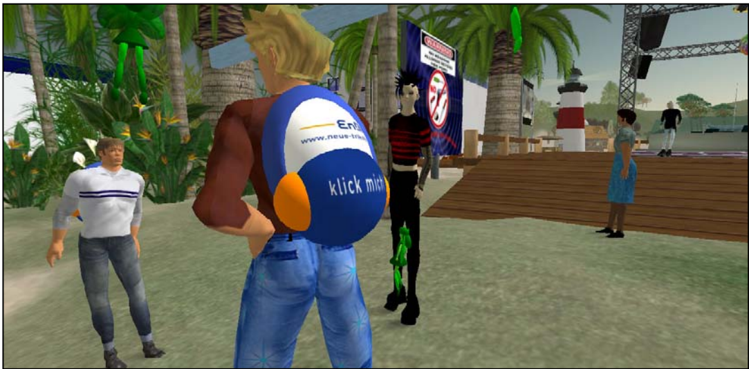
Abbildung 6: Avatar, der EnBW - Trikots in Second Life verteilt

einen einfachen Klick ein Trikot entnehmen, womit sie zur Verstärkung des Kommunikationseffekts beitragen. Solch einen Avatar zeigt Abbildung 6.