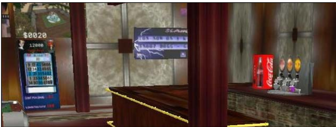
Abbildung 5: Product Placement von Coca Cola in Second Life

Eine für Online-Spiele und andere virtuelle Welten geeignete Kommunikationsform ist das Product Placement. Darunter versteht man die gezielte Platzierung von Produkten bzw. Markenartikeln insbesondere in der Handlung eines Spielfilms oder einer Fernsehsendung 46 bzw. im Rahmen der In-Game-Werbung in einem Video- oder Online-Spiel. Product Placement bietet sich speziell auch in Second Life an, da es sich hierbei um eine der realen Welt recht ähnliche virtuelle Welt handelt und nicht um eine Fantasy- oder Science-Fiction-Welt wie in den meisten Online-Spielen. Es gibt in Second Life zahlreiche Bars, Cafés, Clubs, in denen die Avatare Getränke kaufen können, die ihnen bereits aus dem Real Life bekannt sind. So sind beispielsweise Coca Cola , Becks oder Corona Bier in den Getränkeautomaten der entsprechenden Markenhersteller zu finden. Auch Snacks wie z.B. Chips von Lays oder Walkers begegnen den Avataren in SL. Ein Beispiel für Product Placement der Marke Coca Cola zeigt Abbildung 5.