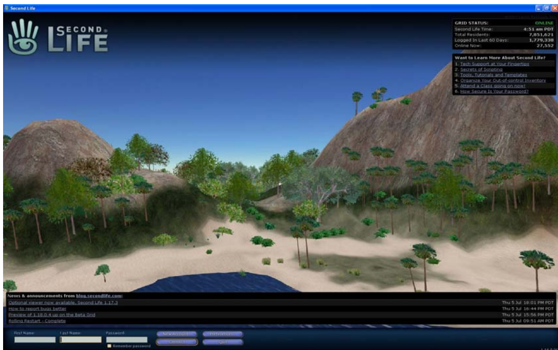
Abbildung 1: Einstiegsseite Second Life

Abbildung 1 zeigt die Startseite zum Einstieg in die virtuelle Welt Second Life. Sowohl die interaktive Freiheit als auch das Wirtschaftssystem machen Second Life für