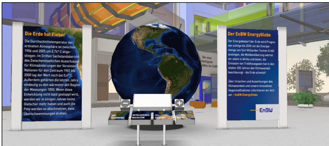
Abbildung 3: Exponat EnBW Energy Globe im EnBW Energy Park in Second Life

gyPark in Second Life eröffnet. Dort werden Innovationen des Unternehmens zum Thema Energie vorgestellt. Es gibt sowohl interaktive Exponate, die zur Erforschung und Begehung mit dem Avatar einladen, als auch Informationstafeln oder Filmmaterial. Der in Abbildung 3 dargestellte Energyglobe ist eines der Exponate. Dabei handelt es sich um ein Modell, auf das verschiedene Szenarien der Entwicklung des Weltklimas projiziert werden können. Während der Hannover Messe bot das EnBW-Forum den virtuellen Besuchern nicht nur Raum für Gespräche und Diskussionen, sondern auch die Möglichkeit, sich persönlich von einem offiziellen EnBW-Betreuer-Avatar durch den Themenpark in SL führen zu lassen. 39