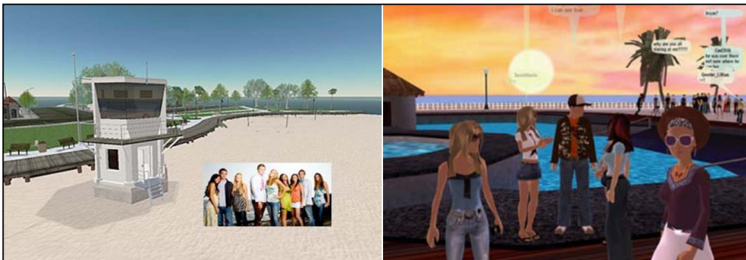
Abbildung 7: Virtual Laguna Beach in Second Life

Nachdem der Prototyp den Verantwortlichen vorgestellt wurde, gab es die Freigabe für die Umsetzung des Projekts auf der Plattform There . Dies ist eine weitere virtuelle Welt, ähnlich Second Life , aber mit weitaus weniger Möglichkeiten zur Anpassung, Programmierung und zur Nutzung anwendergenerierter Inhalte. 56 Sicherlich sind ähnliche Projekte in Zukunft auch in Second Life denkbar und können dafür sorgen, dass sich die Fans bestimmter Fernsehserien noch mehr mit ihrer Serie identifizieren können. Bereits das erläuterte Laguna-Beach -Beispiel zeigt darüber hinaus, dass sich Branded Virtual Worlds grundsätzlich auch für Zwecke des Event-Marketings eignen.