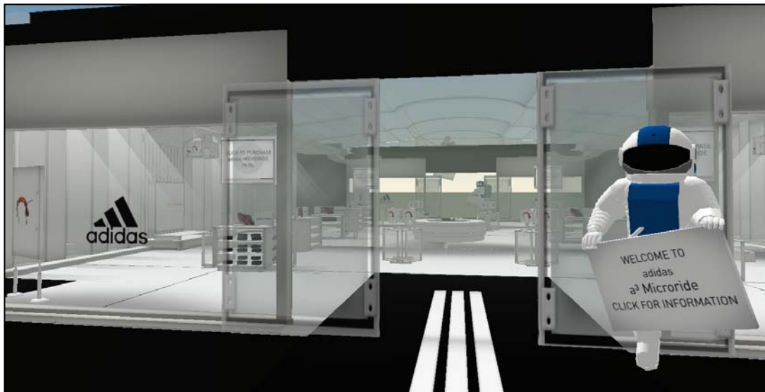
Abbildung 4: Virtueller adidas Shop in Second Life

Ein Ausschnitt aus dem Shop ist in Abbildung 4 dargestellt. Besonders innovativ ist die Idee, dass der virtuelle Schuh beim Tragen das Gehverhalten des Avatars ändert, um die Aufmerksamkeit der anderen Avatare zu erlangen (dazu näheres in Kapitel 4.3.6).