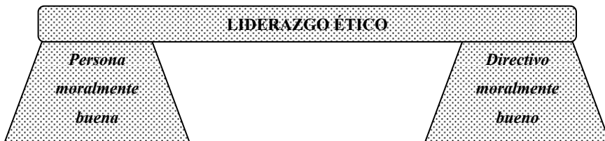
Figura 2. Los pilares del liderazgo ético