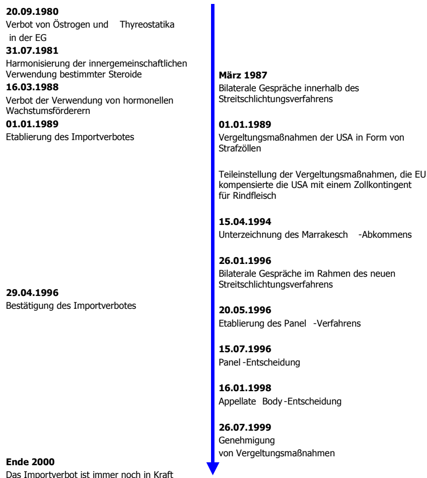
Schaubild 2: Der zeitliche Ablauf des Hormonstreites