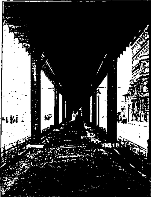
Einer von den Berliner „Spielplätzen“ Bürgermeister Reickes. Es ist dies der Fußweg unter der Hochbahn, Gitschiner Straße. Rechts und links fährt die elektrische Straßenbahn. Als Ehrung wird von Bewunderern des Bürgermeisters angefragt, nach seiner Pensionierung diesen schmucken Spielplatz „Reickeplatz“ zu taufen.