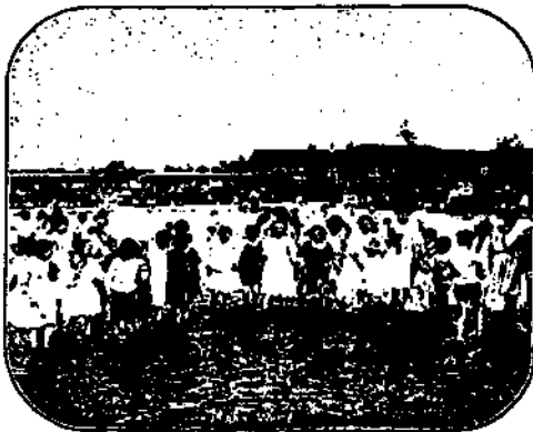
Planschwiese (im Hintergrunde das öffentl. Gesellschaftshaus).