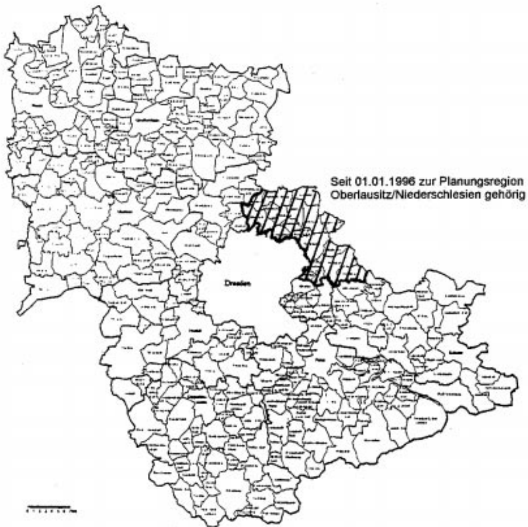
Abbildung 2 Planungsregion Oberes Elbtal/Osterzgebirge

Die Abgrenzung des Planungsraumes vor Inkrafttreten der Kreisreform Anfang 1996 erlaubte es, Raumordnungsprobleme im Großraum Dresden im Planungsverband zu bearbeiten, da die Agglomeration durch den Landkreis Dresden im Nordosten der Stadt vollständig erfaßt wurde. Seit der Neugliederung reicht der zur Planungsregion Oberlausitz/Niederschlesien gehörige Westlausitzkreis bis an die Stadt heran. Es ist offensichtlich, daß dies eine Kooperation zwischen Dresden und seinem Umland im Rahmen der Regionalplanung erschwert, da für den Nordosten der Stadt nun ein zweiter Verband in den Abstimmungsprozeß einbezogen werden muß.