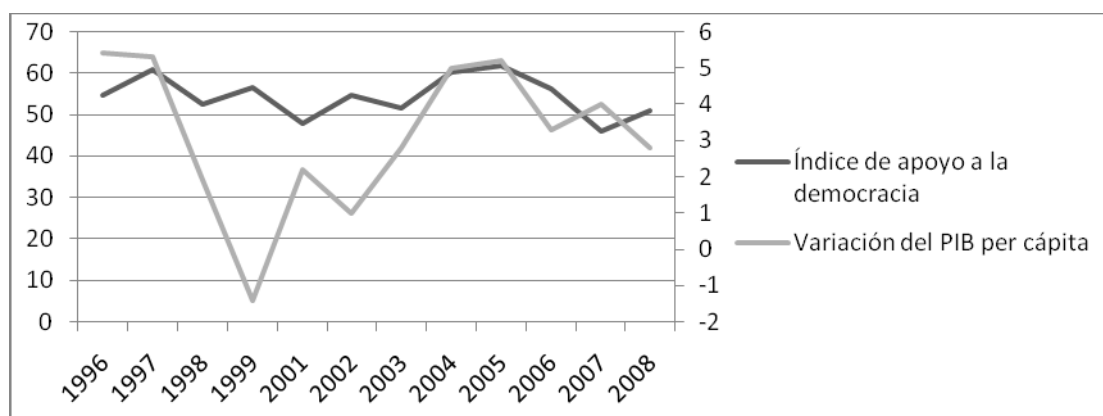
Grafico 2: Relación entre el índice de apoyo a la democracia y las variaciones del producto interno bruto per cápita en Chile