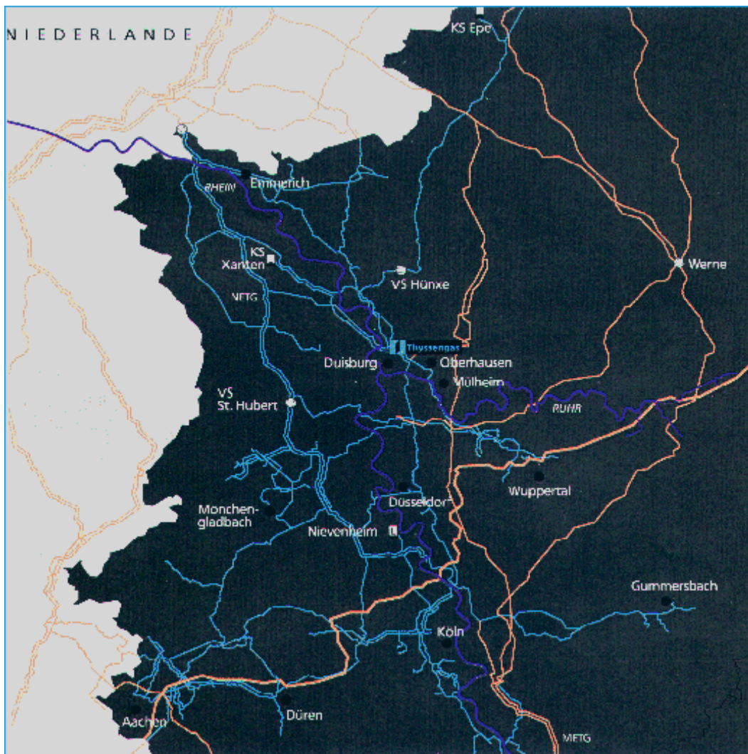
Abbildung 4: Gastransportnetz der Thyssengas GmbH