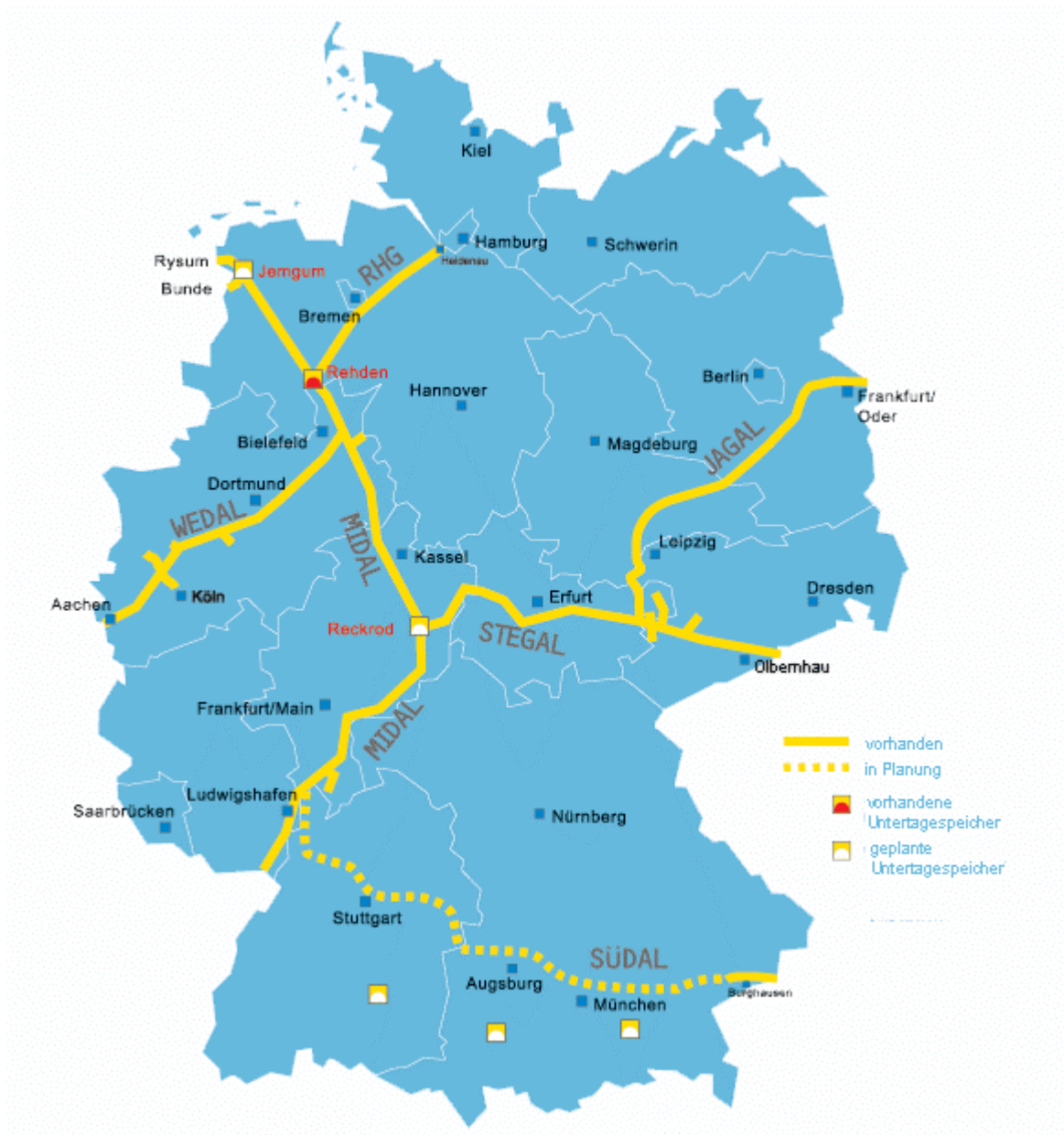
Abbildung 1: Gastransportnetz der Wingas GmbH