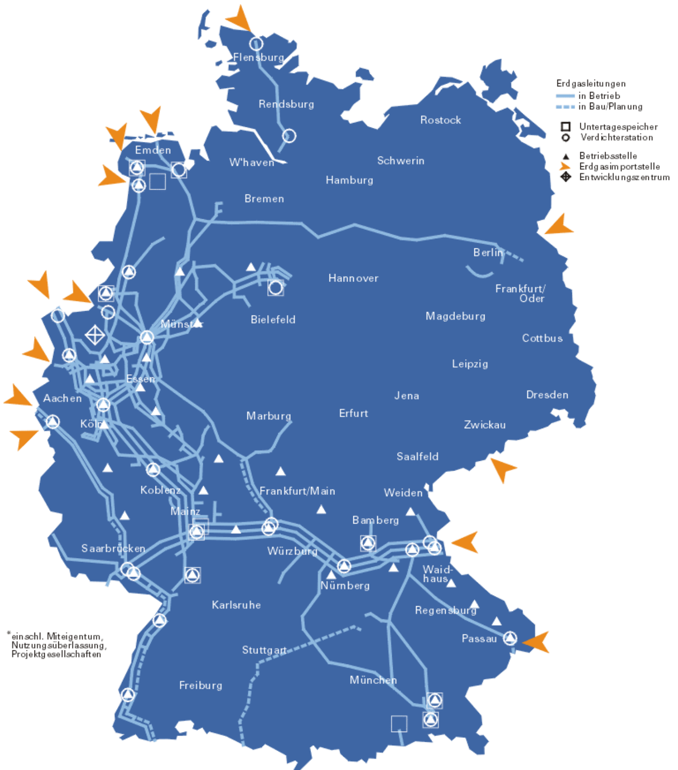
Abbildung 2: Gastransportnetz der Ruhrgas AG