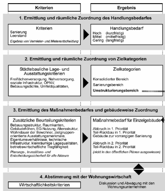
Abbildung 1: Vorgehensweise bei der Erarbeitung des STEP (Grafik der Stadt Leipzig)

Die Ergebnisse der Analyse wurden schließlich im vierten Schritt mit den Vorstellungen der Wohnungsunternehmen abgewogen. Die Ergebnisse dieser Abwägung wurden im typisch Leipziger Stil „Pakt der Vernunft“ genannt (s.u.).