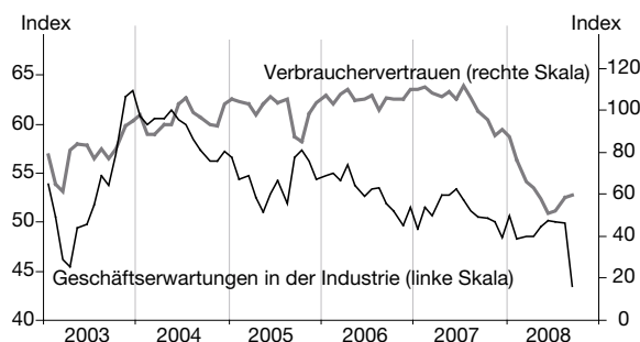
Abbildung 1 Klimaindikatoren

Der reale private Konsum ist denn auch seit dem Sommer deutlich rückläufig und dürfte unter diesen Bedingungen vorläufig weiter sinken. Besonders stark gingen die Autokäufe zurück, und dieser Trend dürfte aufgrund der rigideren Vergabe von Autokrediten noch anhalten. Der Wohnungsbau wird angesichts der umfangreichen Leerstände und der hohen Zahl an Zwangsverkäufen seine seit 2006 anhaltende Talfahrt zunächst fortsetzen. Die schwächere Binnennachfrage und die verschlechterten Absatz- und Ertragsperspektiven wirken sich auch dämpfend auf die Unternehmensinvestitionen aus, zumal sich die Finanzierungsmöglichkeiten erschwert und verteuert haben; der Zins für „zweitklassige“ Unternehmensanleihen ist mittlerweile auf durchschnittlich 8% gestiegen. Positive Impulse kamen bislang noch vom Außenhandel; die Exporte profitierten von der wechselkursbedingt verbesserten Wettbewerbsfähigkeit, während die Importe aufgrund der schwachen Binnennachfrage sanken. Da aber die kontraktiven Impulse von der Binnennach-