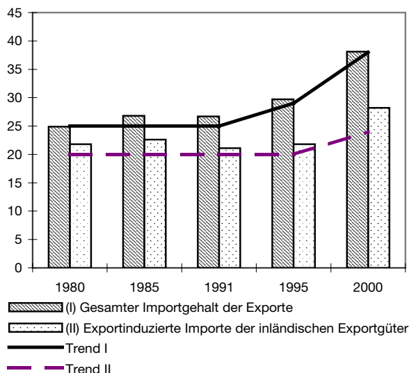
Abbildung 1 Importgehalt der Exporte in Deutschland zwischen 1980 und 2000 (in % aller Exporte bzw. der Exportgüter aus dem Inland)

Standardmodell der offenen statischen Input-Output-Analyse begründen. Dies geschieht im Folgenden, wobei der Kreis der einbezogenen Länder durch die Verfügbarkeit amtlicher Input-Output-Tabellen einschließlich Importmatrizen begrenzt ist.