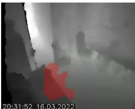
Abbildung 2: Bild Videoaufzeichnung Sensor

Zu Beginn des Projektes hat der Sensor bereits Stürze erkannt. Die Sturzerkennung erfolgte regelbasiert, das heißt, sobald ein Gegenstand unterhalb einer gewissen Linie registriert wird, wird ein Alarm ausgelöst. Bei einem erkannten Sturz wird ein akustischer Alarm auf mobile Endgeräte oder DECT-Telefone gesendet; gleichzeitig erfolgt eine automatische Dokumentation inklusive Videoaufzeichnung zur besseren Nachvollziehbarkeit. Dabei handelt es sich nicht um eine Klarbildaufzeichnung, sondern es sind lediglich schemenhafte Umrisse einer Person zu erkennen, wie in Abbildung 2 deutlich wird.