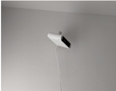
Abbildung 1: Deckensensor im Wohnendenzimmer

Das entwickelte System basiert auf einem Sturzsensor, der an der Decke in den Zimmern der Bewohnenden angebracht wird (Abbildung 1).