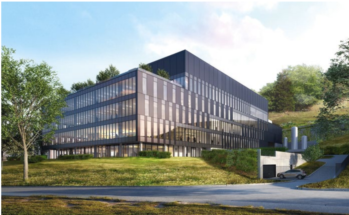
Merck Biotech-Entwicklungszentrum.

Ein weiteres Beispiel für erfolgreiches Engagement in der Pharma-Industrie ist unser Ambassador-Programm. Dieses Programm geht über traditionelle Produktmarketingstrategien hinaus, indem es Senior Leadership regelmässig mit wichtigen Stakeholdern aus dem Therapiegebiet, wie Patient Advocacy