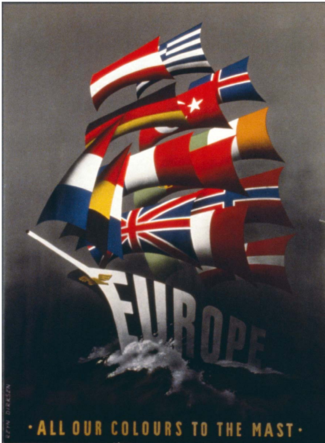
All Our Colours to the Mast – Alle unsere Flaggen hissen , Reyn Dirksen. Katalog ID 1020 (im Deutschen Historischen Museum als Plakat erhältlich; Inventurnr. 1988/1442.3.) Erläuterungen : Vorsegel = Benelux; Fockmast = ehemalige Großmächte; Hauptmast = Die Mittelmeerländer; Besanmast = nordische Länder.