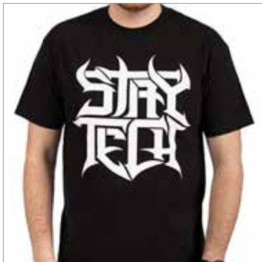
Abbildung 1: T-Shirt-Design der Band Archspire, https://www.indiemerch.com/archspire/item/30207

Death Metal, die ihren Namen durch ein besonderes Maß an spieltechnischen Fähigkeiten der Instrumentalist/-innen erhielt. Vereinfacht lässt sich die Musik nach der Vorgabe „höher, schneller, weiter“ beschreiben. Von den Musikern/Musikerinnen werden sehr gute Fähigkeiten im Umgang mit ihren Instrumenten vorausgesetzt, um Tech Death umsetzen zu können. Die Band Archspire thematisiert diesen Aspekt etwa in Bezug auf das Tempo eines Songs, der nach ihren Angaben in 400 bpm eingespielt wurde (vgl. https://metalinjection.net/new-music/archspire-flies-through-new-single-bleed-the-future , aufgerufen am 17.4.2023). Die Band verwendet den Hashtag „staytech“ in ihrer Kommunikation (vgl. https://www.facebook.com/Archspireband , aufgerufen am 15.4.2023) und für das Design ihrer T-Shirts (vgl. https://www.indiemerch.com/archspire/item/30207 ). Ihre Genrezugehörigkeit machen Archspire somit zum Bestandteil ihrer Marke.