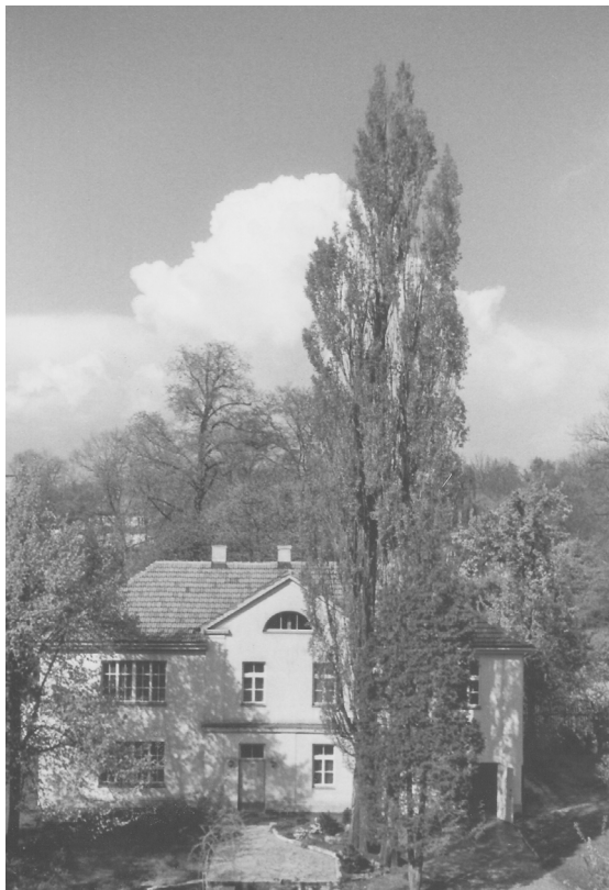
Das ursprüngliche Gartenhaus der Villa Heymel, 1957.

Im Juli 1969 konnten die ersten Bauarbeiten beginnen. Ende 1969 war der Rohbau weitgehend abgeschlossen, nur ein Jahr nach Baubeginn das neue Gebäude bezugsfertig. Am 12. Oktober 1970 wurde die Einweihung mit Bier und Brezen in der neu eingerichteten Kantine gefeiert. Die Abteilungen Industrie und Publizistik sowie die Bibliothek konnten einziehen.