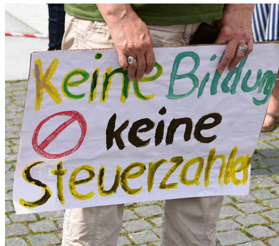
Demonstration für Kinderrechte und gegen die Corona-Maßnahmen für Schul- und Kitakinder im Juli 2020.

Vor besondere Herausforderungen stellte die Coronakrise das Bildungssystem. Umfragen des ifo Instituts kamen zu dem Ergebnis, dass durch Schulschließungen die Zeit, in der sich Schüler*innen gemeinsam mit den Unterrichtsstoffen auseinandersetzen konnten, halbiert worden war. Der Distanzunterricht konnte diese Lücke nicht ausgleichen. Außerdem führte der Lockdown dazu, dass Kinder deutlich mehr Zeit mit Smartphones und Computern verbrachten. Wuchsen sie in bildungsfernen Familien auf, waren sie besonders stark benachteiligt, weil ihnen zuhause niemand beim Lernen helfen konnte. Außerdem zeigte sich ein