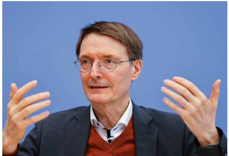
Bundesgesundheitsminister Karl Lauterbach erklärt in einer Pressekonferenz vom 5. April 2023 das Ende der Corona-Schutzmaßnahmen.

In vielen Bereichen wurde die Krise aber auch als Chance begriffen, wichtige Strukturveränderungen auf den Weg zu bringen, die neues Wachstumspotenzial freisetzen. Entwicklungsaussichten in allen Bereichen, vom ökologischen Umbau der Wirtschaft bis zum Ausbau des europäischen Binnenmarkts, ließen die Forschenden auf eine rasche Erholung der Wirtschaft und eine Konsolidierung der Staatsfinanzen hoffen. Doch diese Hoffnungen wurden mit dem Angriff russischer Truppen auf die Ukraine am 24. Februar 2022 beendet.