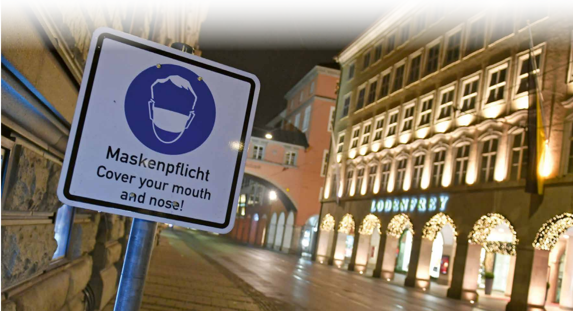
Coronabedingter Lockdown: Leere Straßen in der Fußgängerzone München und ein Schild, das an die Maskenpflicht in Innenstädten erinnert.