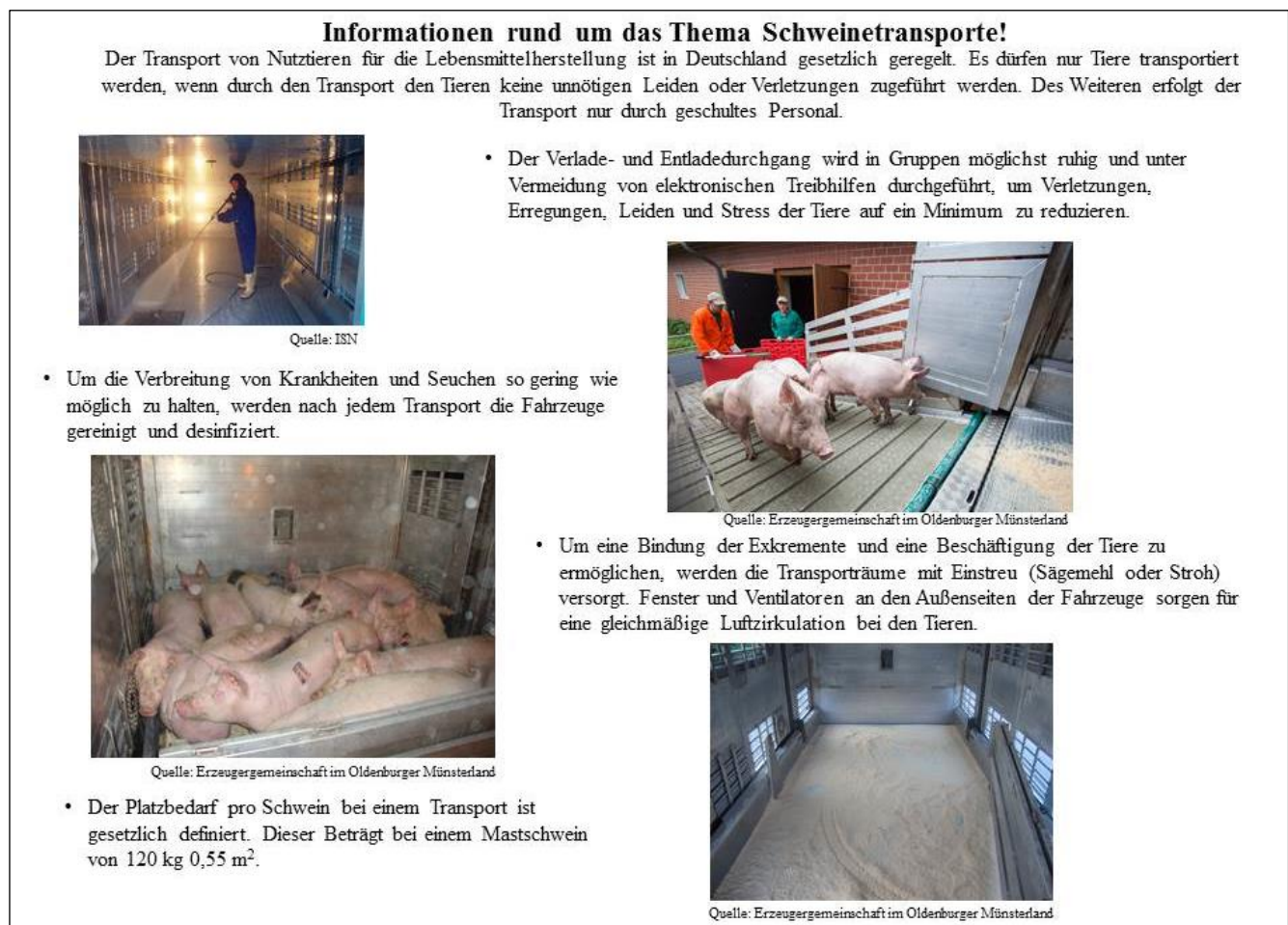
Abbildung 2. Informationen zum Thema Schweinetransporte