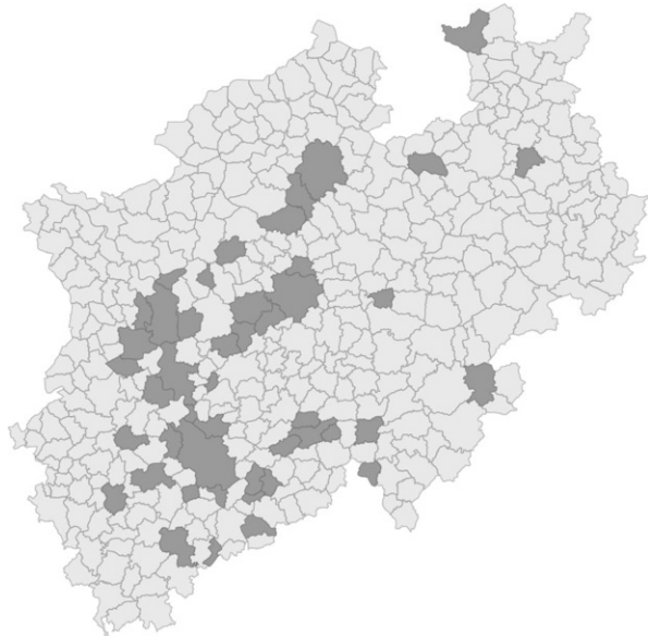
Abb. 2 Nordrhein-westfälische Gemeinden mit und ohne ÖPP (Gemeinden mit ÖPP-Projekten sind dunkelgrau dargestellt, alle übrigen Gemeinden hellgrau )