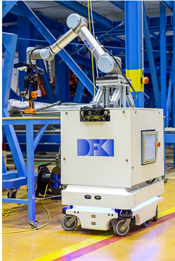
Abb. 3 Der Roboter „Mobi-pick“ nimmt eine Akku-Bohrmaschine in einer Produktionsstätte auf

Ausstattung. Besteht bislang keine Zuordnung, soll der Roboter eine bislang nicht genutzte Werkzeugkiste finden und Nutzer 2 bringen. Hierfür greift der Roboter nicht nur auf einen bekannten Werkzeugspeicher zu, sondern identifiziert mittels Objekterkennung auch Werkzeuge, die an anderen Produktionsinseln nicht mehr benötigt werden; beispielsweise, weil der betreffende Nutzer mittlerweile den Raum verlassen und sein Werkstück mitgenommen hat. Während die Nutzer eigenständig Arbeitsschritte durchführen, verfolgt der Roboter eigenständig das Ziel, die Hypothesen im Hypothesenspeicher durch weitere Beobachtungen zu verfeinern und nicht mehr allokierte Ressourcen für die weitere Benutzung freizugeben. Erhält der Roboter weitere Anfragen, werden diese entsprechend des oben genannten Beispiels bearbeitet. Beendet ein Nutzer seine Arbeit, stellt der Roboter den Ausgangszustand einer Produktionsinsel wieder her, indem er zurückgelassene Werkzeuge und Materialien in das jeweilige KLT-Lager bringt. Dabei soll der Roboter beachten, dass Nutzer unter Umständen eigenes, optisch ähnliches Werkzeug oder Material mitbringen könnten und diese Ressourcen nicht in das Lager des MakerSpaces räumen.