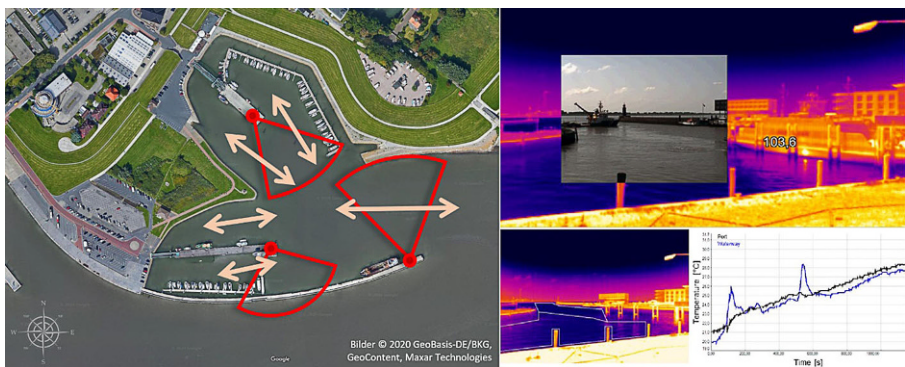
Abb. 4 a Lagebild des Wilhelmshavener Fluthafen (unterer Sektor) und Pontonhafen mit der Nassau- brücke (oberer Sektor). b Detailaufnahmen einzelner Hafenbereiche mittels Wärmebildkamera (farbig) und überlagert Objakterfassung (s/w) (Rüssmeier et al. 2017)

Diese und weitere, externe Informationen werden in einer Modelldarstellung verwendet, um prognostische Aussagen zu ermöglichen. Multimodale Sensorinformationen werden von mindestens drei Stellen bereitgestellt, an denen Farb- und Thermalkameras installiert werden (rote Bereiche in Abb. 4a). Ergänzt werden diese durch einen Laserscanner, der Entfernungsinformationen liefert, und Umweltsensoren für die Wetter- und Seebedingungen. Schiffseigene AIS Informationen (Automatic Identification System) werden ebenfalls verwendet, jedoch sind solche Systeme nur für Schiffe mit einer Länge von mehr als 20 Metern vorgeschrieben und daher in kleineren Häfen selten vollständig verfügbar. Anders als der MobiPick-Roboter, der sich im MakerSpace nahezu frei bewegt, verfügen die Kamerasysteme lediglich über eine rudimentäre Steuerung mit Schwenk-, Neige- und Zoomfunktionen. Umgebungsbedingungen werden von einer nahegelegenen Wetterstation und dem allgemeinen Gezeitenkalender geliefert, um den sich ändernden äußeren Bedingungen im Vorhersagemodell Rechnung zu tragen.