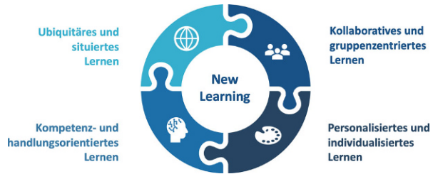
Abb. 1 Anforderungen an das New Learning

New Learning basiert auf Frithjof Bergmanns New-Work-Konzept und hat die Selbst- und Potenzialentfaltung des Individuums zum Ziel. New Learning bezeichnet Lernen, das vom Lernenden als sinnhaft erlebt wird und die Teilhabe an der Gemeinschaft ermöglicht. Die Lernprozesse sind geprägt von Selbstbestimmung, Autonomie und dem Streben nach Wirksamkeit. Dabei gilt, dass die Lerner ein hohes Maß an Selbstverantwortung und die Zugehörigkeit zur (Lern-)Gemeinschaft erleben.