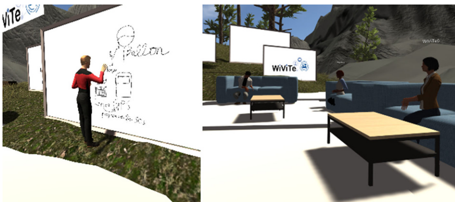
Abb. 5 VR-Forschungslabor