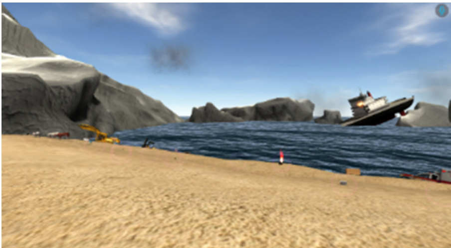
Abb. 4 VR-Strandumgebung

Die ausgewählte VR-Umgebung legt den Fokus auf Zusammenarbeit und Ideenfindung (Wissensgenerierung mithilfe von Kreativitätstechniken) und ist demzufolge ausgestattet. Dementsprechend bietet MS Teams ähnliche Features wie z. B. gemeinsame Dokumentenbearbeitung oder multi-user fähige Whiteboards und Listen. Um die Vergleichbarkeit noch weiter zu gewährleisten, haben beide Gruppen in unterschiedlicher Abfolge jeweils beide Fallstudien durchgeführt (randomisier-