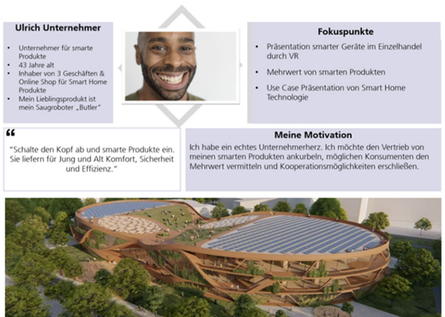
Abb. 2 Exemplarische Problemsituation (oben, Konzepte der digitalen Transformation sind eingerahmt und die verschiedenen Rollen sind unterstrichen ), Ausgestaltung einer Rolle (Mitte) und mögliche Lösungsidee (unten)