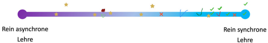
Abb. 4 Whiteboard-Skalierungsabfrage im Rahmen eines virtuellen Erfahrungsaustauschs zur digitalen Lehre

mutiger als im vollständigen Plenum – dieser Effekt kann sich beim Auflösen der Gruppen auf das Verhalten im Plenum übertragen.