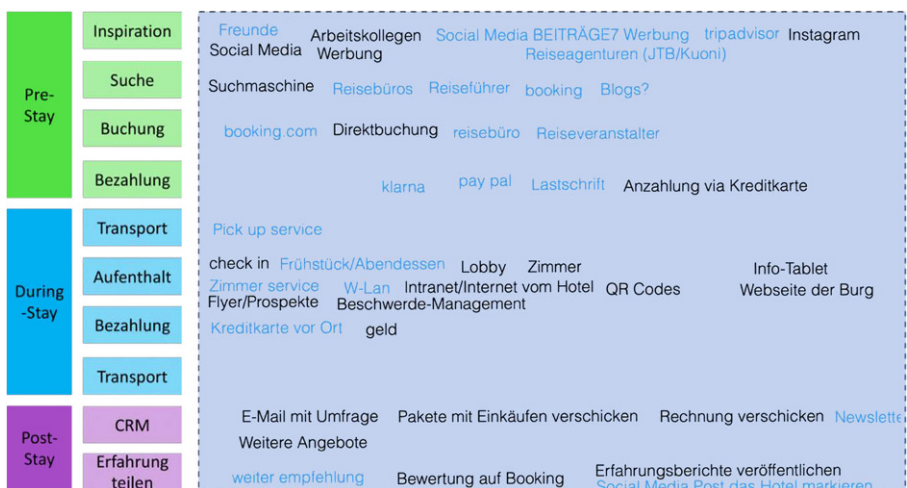
Abb. 3 Whiteboard-Abfrage im Blended Learning Studiengang Interkulturelles Management

Zur Aktivierung von Teilnehmenden einer virtuellen Veranstaltung eignet sich auch gut Gruppenarbeit bzw. generell die Aufteilung in Gruppen zu unterschiedlichen Zwecken. So können in Kleingruppen Sachverhalte diskutiert und Aufgaben gelöst werden. In virtuellen Gruppenräumen/Breakout Sessions lernen sich die Teilnehmenden gleichzeitig auch besser kennen und kommunizieren gelöster und