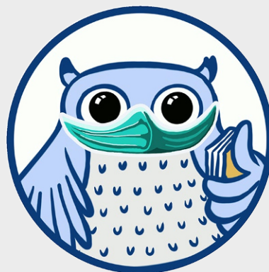
Abb. 2 Avatar von FragBeLa®

Eine erste Testphase fand im Zeitraum Oktober bis Dezember 2018 mit Lehramtsstudierenden und Kolleg*innen des ZLB, des Akademischen Beratungszentrums (ABZ) und des Zentrums für Informations- und Mediendienste (ZIM) statt. Hierzu wurde ein standardisierter Fragebogen, bei dem die Testpersonen die Möglichkeit hatten, neben vorgegebenen Szenarien auch eigene Szenarien zu testen und die oben genannten Easteregg aufzulisten, eingesetzt. Die Resonanz auf den Prototyp war bereits positiv. Die befragten Studierenden regten an, das Userinterface dem Aussehen bekannter Chats wie Telegram oder Whatsapp anzupassen. Eine weitere Evaluierung wurde mit einer Studierendengruppe Ende 2019 durchgeführt. Im Rahmen eines Workshops bei der Tagung #ZukunftBeratung des Zentrums für LehrerInnenbildung (ZfL) Köln am 24. September 2020 stellte das Autorenteam BeLa Berater*innen an Universitäten, Lehrer*innen und Studierenden vor. Die Teilnehmenden testeten im Praxisteil der Präsentation FragBeLa® anhand von vorbereiteten Szenarien. Alle Tests zeigen, dass zu den vorhandenen Themenfeldern wie Praxissemester und EOP noch viel mehr Fragen gestellt werden, als wir im Vorfeld antizipiert haben. Weitere Evaluationen folgen, sobald neue Themenbereiche eingefügt sind.