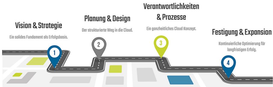
Abb. 2 Die vier Phasen der „Cloud Transformation Roadmap“ (eigene Darstellung)

In der ersten Phase der „Cloud Transformation Roadmap“ werden die Vision und die Strategie festgelegt, welche durch den Cloud-Einstieg verfolgt werden sollen. Hier wird das Fundament für die erfolgreiche Arbeit mit der Cloud gelegt. Die Cloud-Vision beschreibt, was langfristig mit der Cloud erreicht werden soll, wie die Cloud zur Weiterentwicklung des Unternehmens beitragen kann und welche