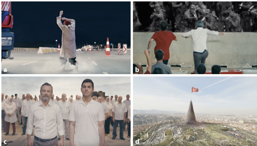
Abb. 2 a Tod der Frau/Fall der Nation, 1:04, b Ansturm des Volkes, 1:47, c Treffen der Märtyrer/ Auferstehung, 2:52, d Die vollendete Nation, 2:55

In beiden Videoclips 8 findet die metaphorische Legitimationskraft des Neuen Autoritarismus seinen topologischen Niederschlag. Sie sind keine Wahlwerbungen, die Brückenschläge zu den Präferenzen eines (noch) verunsicherten Wahlvolkes zu schlagen versuchten. Sie setzen sich vielmehr zu einer visuellen Performanz zusammen, durch die sich das Wir des Volkes mit der Erfahrung der Putschnacht neu justiert und szenografisch aufrichtet. Die Clips geben nicht nur vor, wie die Putschnacht zu begreifen ist. Sie setzen sie in das Format eines nationalen Gründungsmythos und beflügeln als Schauplatz eines unmittelbaren Evidenzerlebnisses die Idee einer Neuen Türkei , ohne sich auf die fragilen Überredungsrhetoriken eines Machtprotagonisten beschränken zu müssen.