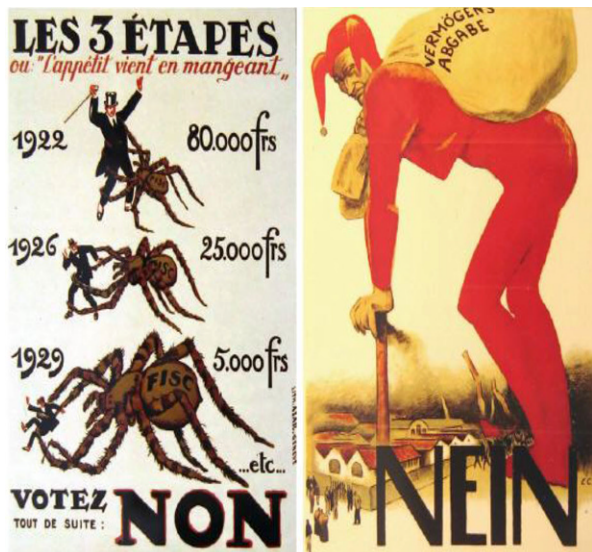
Abb. 3 Beispiele für Plakate der Abstimmungsgegner. (Quelle: Wikimedia commons, Plakat links: Autor Jules Courvoisier (gemeinfrei auffindbar auf https://commons.wikimedia.org/wiki/File:Les_3_etapes_1922.jpg ), Plakat rechts: Autor Emil Cardinaux (gemeinfrei auffindbar auf https://commons.wikimedia.org/wiki/File:Plakat_Einmalige_Abgabe_1922.jpg )

Die Gegner der Vermögensabgabe hatten Argumente, von denen sie weite Teile der Bevölkerung überzeugen konnten. Die Überzeugungsarbeit wurde einerseits, ähnlich wie auch heute, über emotionale Plakat-Kampagnen geführt. Sie stellten die theoretisch wesentlichen Nachteile einer einmaligen Vermögensabgabe visuell dar. Abb. 3 zeigt exemplarisch zwei Plakate der Gegner, welche die Last, die eine Vermögensabgabe darstellt, veranschaulichen. Die Plakate spielen auch auf den Enteignungscharakter solcher Abgaben und auf die Unglaubwürdigkeit des Einmal-Charakters an. Beim Schweizer Sozialarchiv finden sich zahlreiche weitere Plakate, welche zusätzlich noch den zu erwartenden Verwaltungsaufwand, eine drohende Inflation und weiter steigende Steuern aufgrund eines wirtschaftlichen Einbruchs thematisieren. Dem Gegenüber finden sich nur sehr vereinzelt Plakate der Befür-