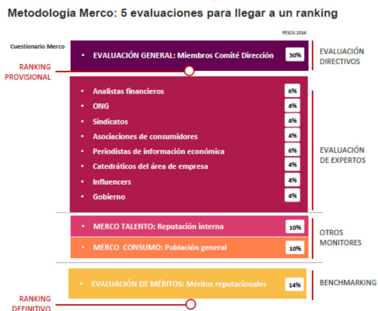
Figura 2. Medición reputación

¿En qué consiste la metodología del escalafón MERCO? Se basa en una metodología multistakeholder compuesta por cuatro evaluaciones y cerca de veinte fuentes de información (Figura 2). Existen voces como las de Boulstridge & Carrigan (2000) que se niegan a medir la reputación tomando en consideración todos los stakeholders, pues argumentan que sólo se deben tener en cuenta los que son verdaderamente relevantes para la organización. O como la de Bromley (2002), que sostiene que, pese a que la reputación se construye colectivamente, ésta se hace a partir de un grupo homogéneo de personas que tienen intereses comunes en la organización. Por el contrario, hay autores como Fombrun (1995) que hablan de perspectivas generales, considerando stakeholders tanto internos como externos. O como la de Tischer & Hildebrandt (2014) que definen reputación como “una percepción relativamente estable, agregada e indirectamente sugestionable, al interior de múltiples grupos de stakeholders, basada en las decisiones pasadas de la organización y en las futuras perspectivas, en relación con alguna referencia”. Existe también una tercera vía como la de Walker (2010) que intenta conciliar ambas posturas haciendo referencia a reputación de un tema específico a través de la opinión de diferentes grupos de stakeholders. O bien, el agregado de una reputación general construida por medio de opiniones separadas de los stakeholders según su tema de dominio.