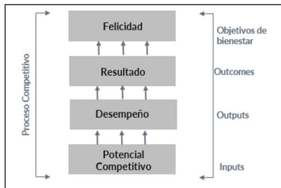
Figura 2: Modelo de construcción competitiva