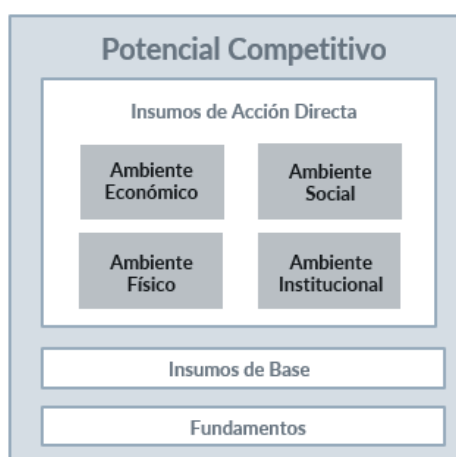
Figura 3: Ambientes del Potencial Competitivo

Dado dicho marco teórico, y considerando el objetivo del Índice a construir, que pretende aportar a la planificación y seguimiento de políticas, se definió que la construcción del Índice de Potencial Competitivo abarque solamente los insumos de acción directa. Estos insumos de acción directa, tal como puede observarse en la Figura 3, están categorizados en cuatro ambientes.