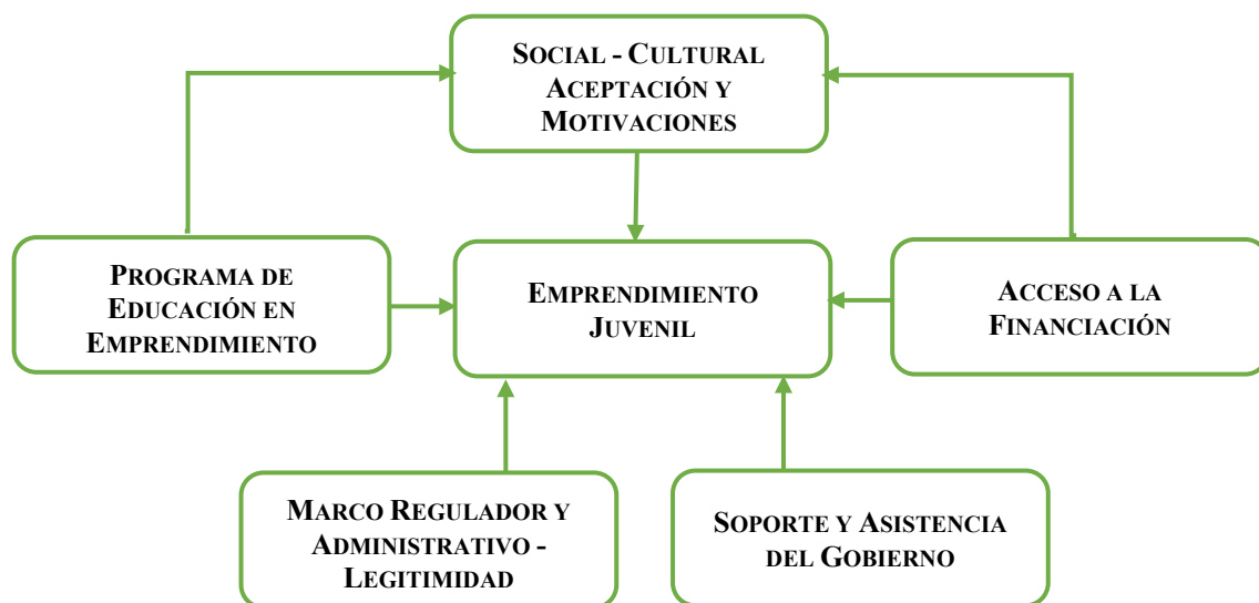
Figura 1. Fuerzas institucionales sobre emprendimiento juvenil.