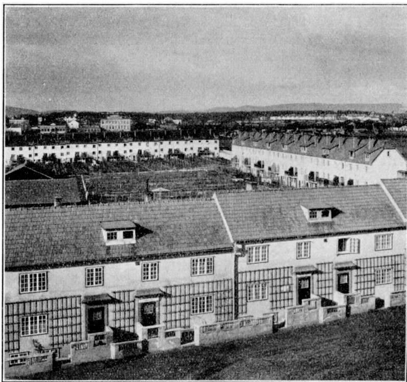
Abb. I: Genossenschaftsiedlung Hoffingergasse (Wien, XII. Bezirk) mit Ausgärten. Im Hintergrunde: Siedlung Tivoli.

Eine der Wiener Genossenschaftsiedlungen zeigt das folgende Bild: