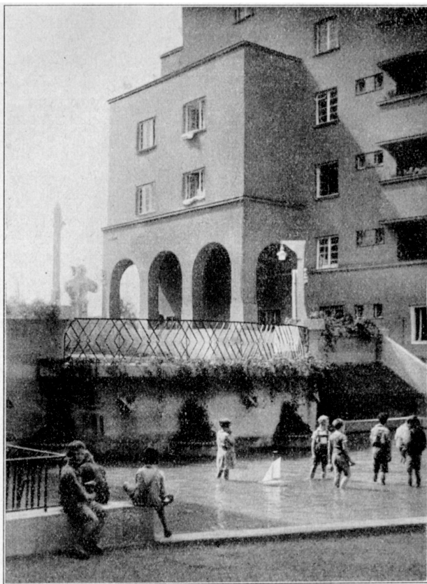
Abb. II: Herwegh-Hof am Margarethengürtel (Wien, V. Bezirk). Hofraum mit Pflanzbecken.

und 309 Bannen sowie Aufenthaltsräume, in denen die Kinder bei ungünstigem Wetter unter Aufsicht von Hausgenossen oder von fachkundigen Aufsichtspersonen spielen und lernen können. Mitunter schließt sich daran eine Lesezimmer mit einer kleinen Bücherei oder eine