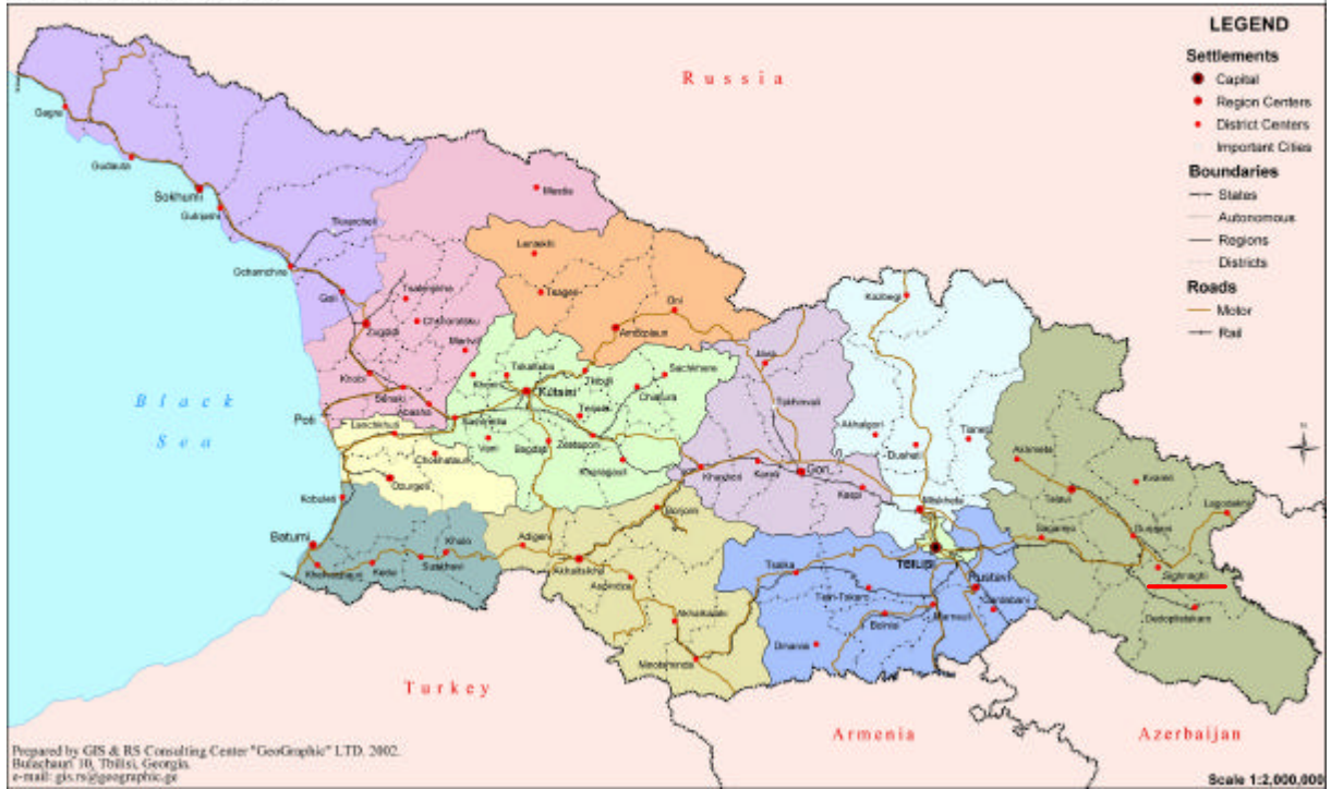
GEORGIA. Administrative Map