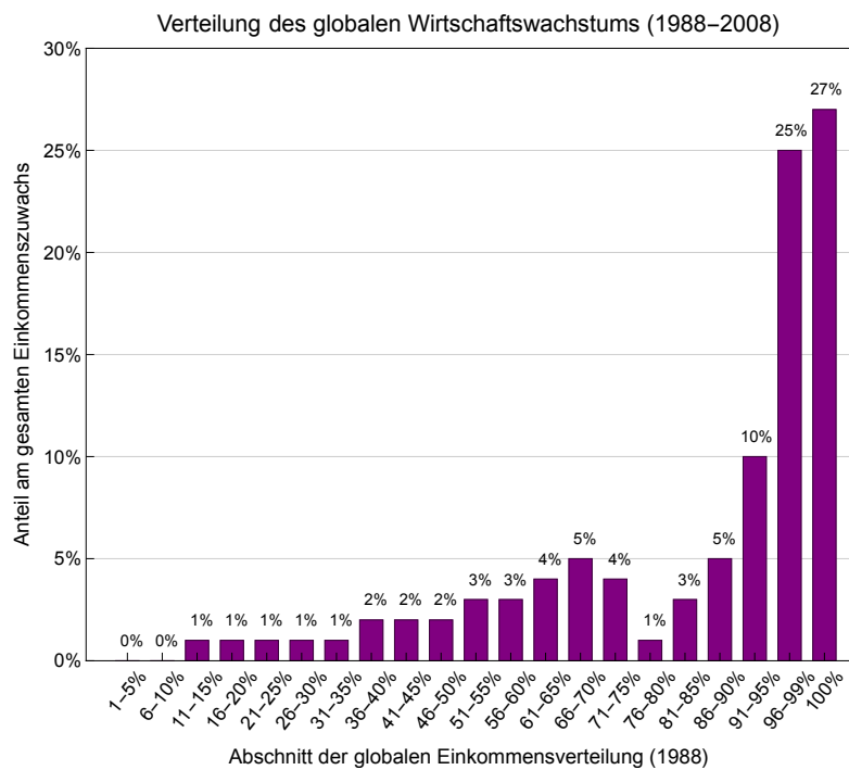
Abbildung 1: Verteilung der globalen Einkommenszuwächse