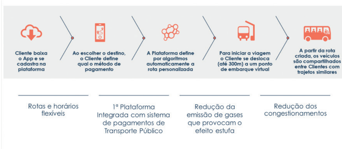
FIGURA 2 Modelo de negócio CityBus