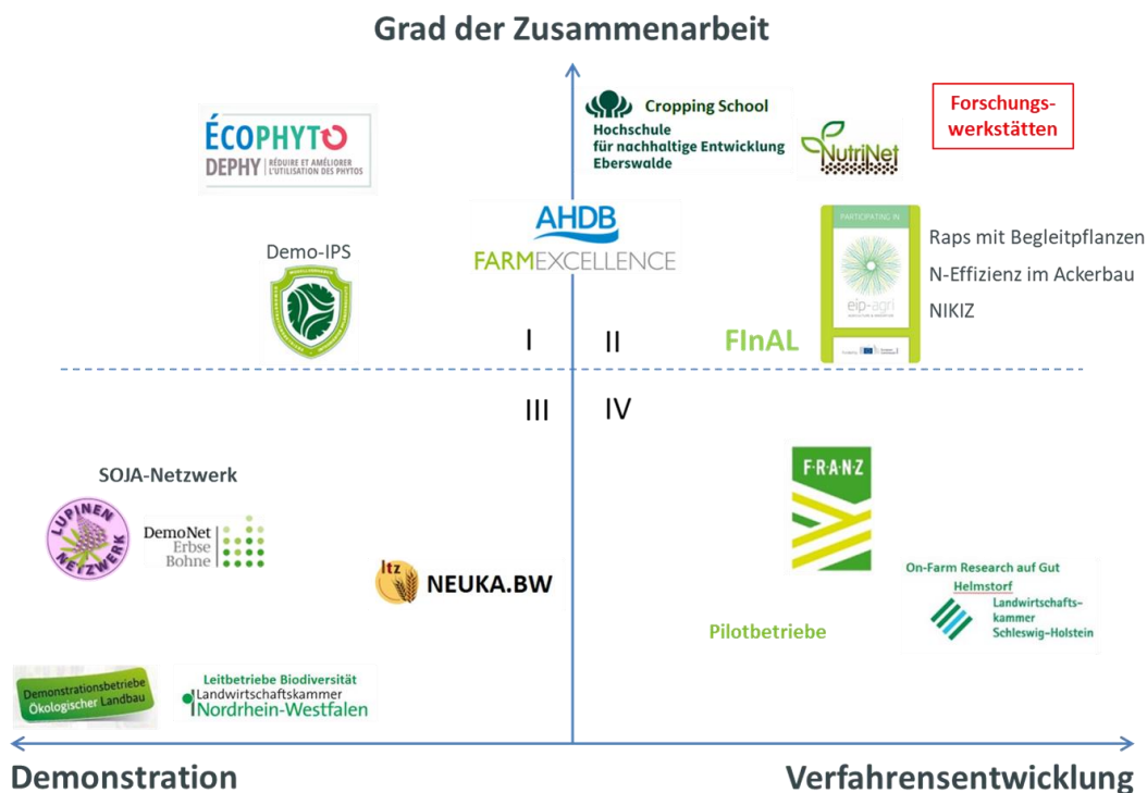
Abbildung 1: Einordnung ausgewählter Praxisforschungsprojekte und des Konzepts der „Forschungswerkstätten“ (Stand Sommer 2020)