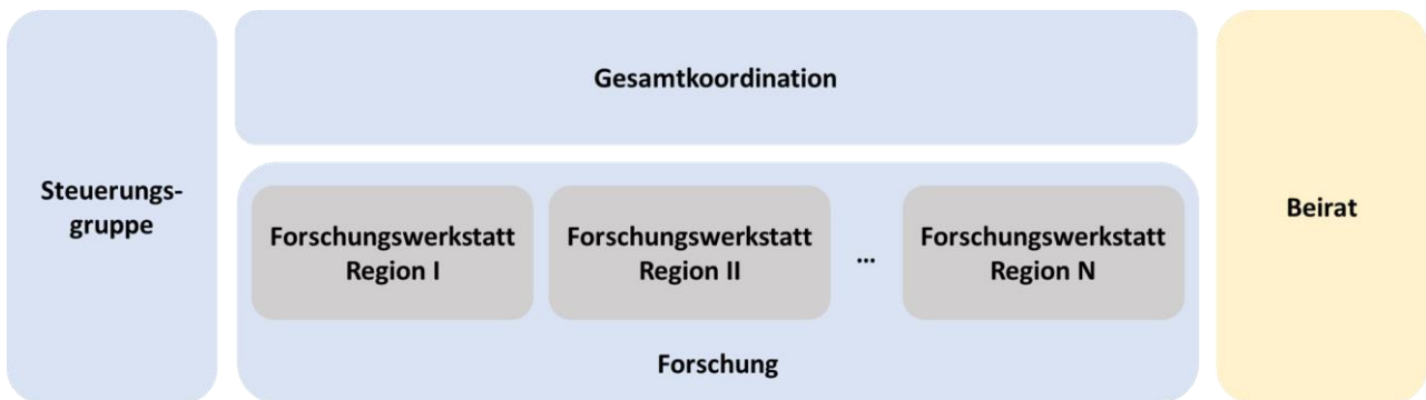
Abbildung 3: Die Gremien der Forschungswerkstätten