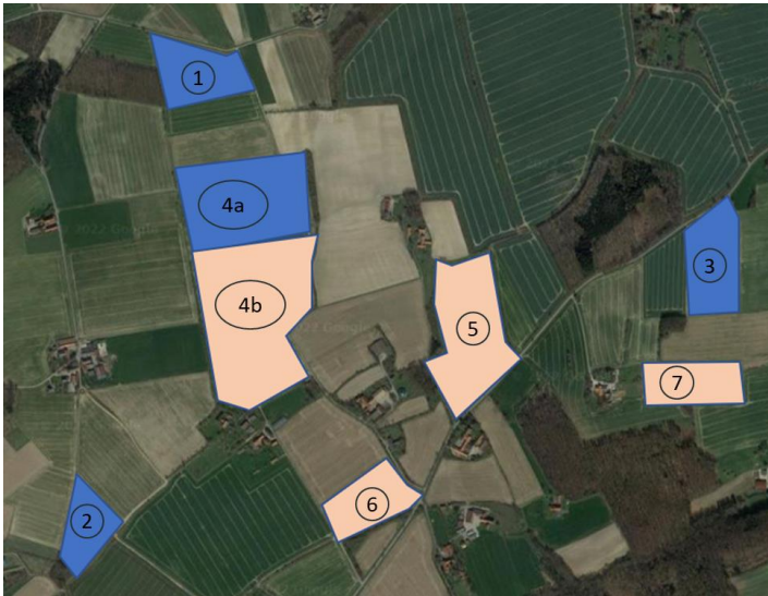
Abbildung 4: Vorschlag Systemansatz

Ein Betrieb bewirtschaftet alle 7 Flächen.