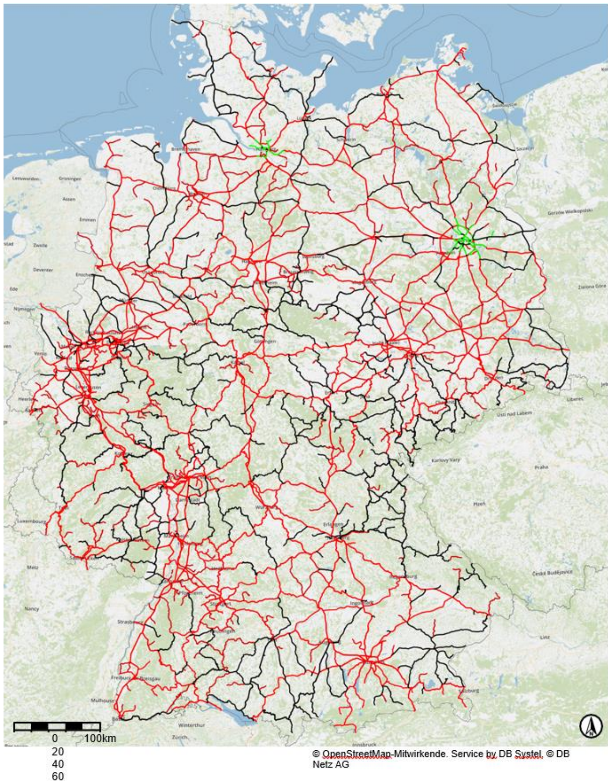
Abbildung 2: Bundesschiennetz 2021 nach Traktionsart aus dem Infrastrukturregister der Deutschen Bahn [21]: Elektrifizierte DB-Strecken sind hellrot (Oberleitung) und grün (Stromschiene) dargestellt, nicht elektrifizierte DB-Strecken schwarz. Nicht-DB-Strecken sind dunkelrot eingezeichnet.