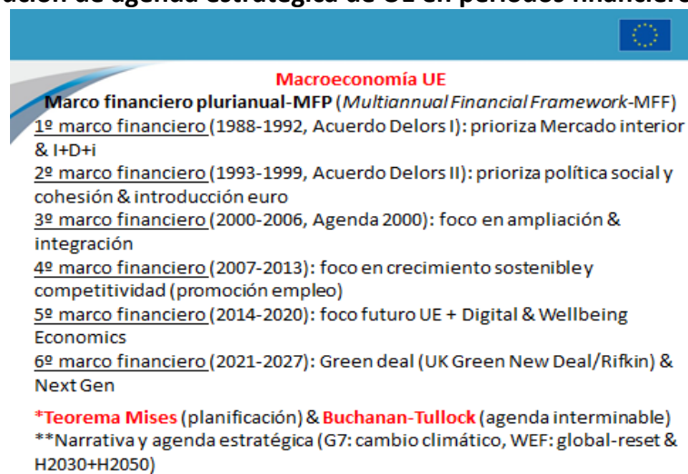
Figura 2: Evolución de agenda estratégica de UE en periodos financieros plurianuales

orden espontáneo (desarrollando la mano invisible de Smith, 1776), a favor de las instituciones sociales evolutivas (Hayek, 1952) –ergo no diseñadas, a diferencia de las tesis neo y poskeynesianas. Dicha tesis es completada con el teorema Mises-Huerta de Soto sobre la eficiencia dinámica (Mises, 1949; Huerta de Soto, 2009). En términos metodológicos, además, EAE ofrece diversos recursos desde sus inicios, con su methodenstreit o disputa por el método (Menger, 1883; Mises, 1949; Huerta de Soto, 1992. Hoppe, 1995). En esta revisión se amplía a otros aportes complementarios, como los estudios de caso de Grice-Hutchinson (1976) o las modelizaciones de Machlup (1954) o Garrison (2001). Por tanto, entre la metodología empleada en este estudio de revisión cabe destacar el análisis crítico-hermenéutico (para la parte teórica) e histórico-comparado (para la parte práctica o empírica –que no experimental, Sánchez-Bayón, 2022), además del método genético-causal de EAE y el individualismo metodológico de EAE y NEI.