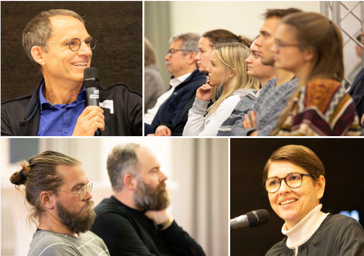
Abb. 1: Die 34. Bremer Universitätsgespräche