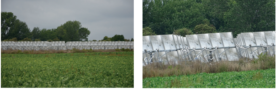
Abb. 4: Beispiel für eine Flächensolarthermieanlage in Lendemarke in Dänemark

Agri-Photovoltaikanlagen hingegen sind bereits Stand der Technik und sind kürzlich auch als Nachnutzungsoption für Strukturwandelgebiete zur Diskussion gestellt worden, in diesem Fall für das ehemalige rheinische Braunkohlengebiet.