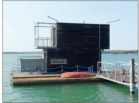
Abb. 2: Zeit nach dem Braunkohlebergbau, links: Denkmal für ein Dorf, das für den Braunkohlenabbau in der Lausitz ‚weggerissen‘ wurde, rechts: schwimmende Häuser auf dem gefluteten Geierswalder See (Tagebaurestloch) für touristische Zwecke

Das Lausitzer Bergbauggebiet in Ostdeutschland ist ein anschauliches Beispiel für die sozialen Auswirkungen des Bergbaus und seiner Schließung in einer Region. Während in der DDR 30 Tagebaue in der Lausitz für den Braunkohleabbau genutzt wurden und 75.000 Menschen beschäftigt waren, gibt es derzeit noch vier aktive Tagebaue (Welzow-Süd, Jänschwalde, Nochten, Reichwalde). Im Rahmen des Kohleausstiegs sollen diese Tagebaue bis 2038 ebenfalls geschlossen werden. Viele Menschen arbeiten bereits in der Bergbausanierung, um der Region ein neues Gesicht und eine Zukunft zu geben. Eine grundlegende Maßnahme hierfür ist die Wiederherstellung des Landschaftsbildes und speziell des Landschaftswasserhaushaltes. Dies geschieht durch die Einstellung der Grubenwasserhaltung, sodass das Grundwasser wieder auf das natürliche Niveau ansteigen kann. Auf diese Weise füllen sich die Tagebaurestlöcher mit Wasser und es entstehen Seen wie in Abb. 1 zu erkennen. Man spricht hierbei von Tagebauflutung.