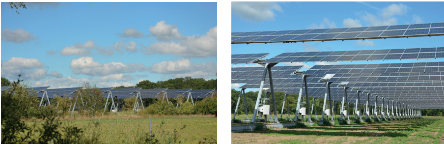
Abb. 3: Beispiel für eine Agri-Photovoltaikanlage, hier Lüchow, Niedersachsen

Im Zusammenhang mit der Erzeugung regenerativer Energien kommt auch die Implementierung weiterer Formen der Erzeugung erneuerbarer Energie wie beispielsweise Photovoltaik, oder noch besserer neuartiger Technologien, infrage, wie beispielsweise die Nutzung von Agri-Photovoltaik (Fraunhofer ISE 2020) oder Flächensolarthermie (falls sich der Nähe Wohnquartiere befinden) (Jensen/Sifnaios/Caringal et al. 2022). Der Vorteil der Agri-Photovoltaik als Landnutzungsform ist deren Multifunktionalität, das heißt die Möglichkeit der parallelen landwirtschaftlichen Nutzung mit Stromproduktion. Dies kann die Erzeugung landwirtschaftlicher Produkte betreffen, aber auch Tierhaltung unter Agri-Photovoltaikanlagen. Abb. 3 zeigt beispielhaft die Agri-Photovoltaikanlage in Lüchow (Niedersachsen), wo die Erzeugung von Solarenergie mit dem Anbau von Beerenobst gekoppelt ist. Eine Reihe derartiger Anlagen befindet sich derzeit in der Vorbereitung, die größte davon in Apenburg in Sachsen-Anhalt mit einer Fläche von 34 Hektar. Vor dem Hintergrund des sich weiter entwickelnden Energieversorgungsproblems in Deutschland ist aber nicht absehbar, dass der Flächenbedarf für derartige Anlagen einem abnehmenden Trend unterliegen könnte.