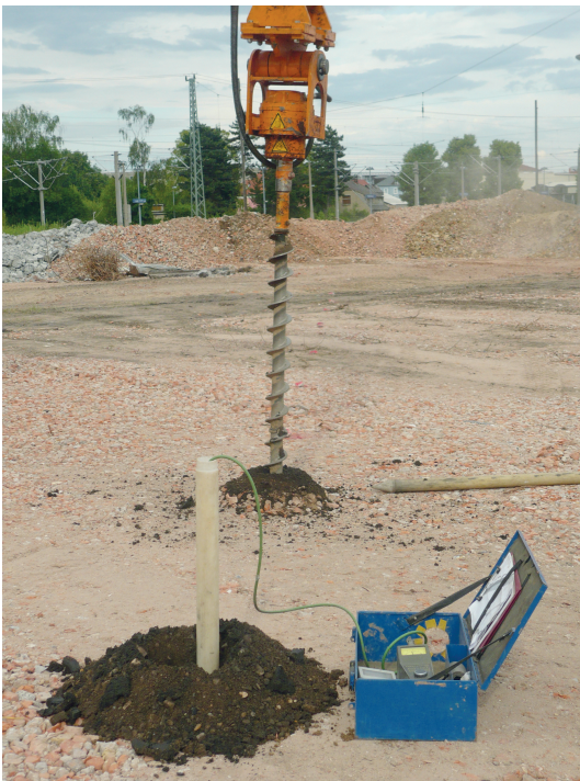
Abb. 2: Kampfmittelsondierung auf einer ehemaligen Industriebrache

Der Verdacht auf Kampfmittel und Kampfstoffe macht eine entsprechende Erkundung der Fläche nötig. Im ersten Schritt werden hierfür historische Daten, wie z. B. Luftbilder, ausgewertet. Im nächsten Schritt erfolgt, bei Verdichtung des Verdachts, eine Standorterkundung hinsichtlich der Problematik der Kampfmittel und Kampfstoffe. Typischerweise werden hierfür geophysikalische Sondierungsmethoden eingesetzt. Abb. 2 zeigt die Kampfmittelsondierung auf einer ehemaligen Industriebrache.