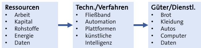
Abb. 2: Daten im Produktions- und Umwandlungsprozess

Daten gehen nicht allein als Produktionsfaktor in die makroökonomische Produktionsfunktion, sondern umfassend in den volkswirtschaftlichen Produktionsprozess ein, der allgemein als Umwandlung von Ressourcen in Güter und Dienstleistungen verstanden werden kann (vgl. Abbildung 2).