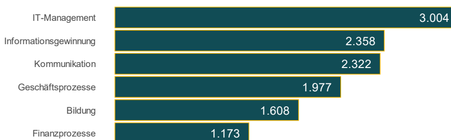
Abb. 3: Tätigkeitsfelder und Anzahl der Einzelaufgaben