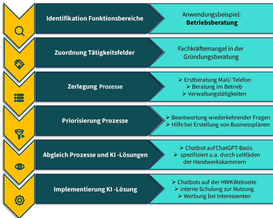
Abb. 4: Vorgehen KI-Einführung innerhalb einer Organisation mit Anwendungsbeispiel