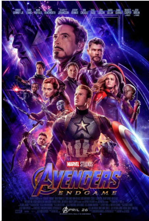
פוסטר הסרט הנוקמים: סוף המשחק (2019)

ג'יימס מקמהון שבחן את ההיסטוריה של תפיסת הסיכון בעסקי הסרטים של הוליווד מפרספקטיבה של תיאוריית הון-כוח, הגיע למסקנה הפוכה. לפי מקמהון, רמת הסיכון בקפיטליזם נקבעת על פי הביטחון של הקפיטליסטים ביכולת הקבוצות השליטות להכתיב את היררכיית יחסי הכוח, או במובן המייד, את סדר חלוקת ההכנסות והקניין.