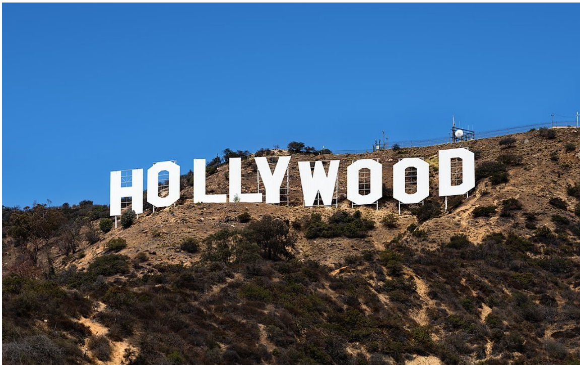
השלט הוליווד בלוס-אנג'לס קליפורניה

"תוך פחות מארבעים שנה הצליחו בעלי הסרטים לא רק להכפיל את הריכוזיות לנקודה שבה כ-90% מהכנסות הסרטים מתקבלות מ-10% בלבד מכלל הסרטים, אלא גם לצמצם פי ארבעה את הסיכון הדיפרנציאלי של רווחיהם" • מתוך ספרם של יהונתן ניצן ושמשון ביכלר, ההון ושברו.