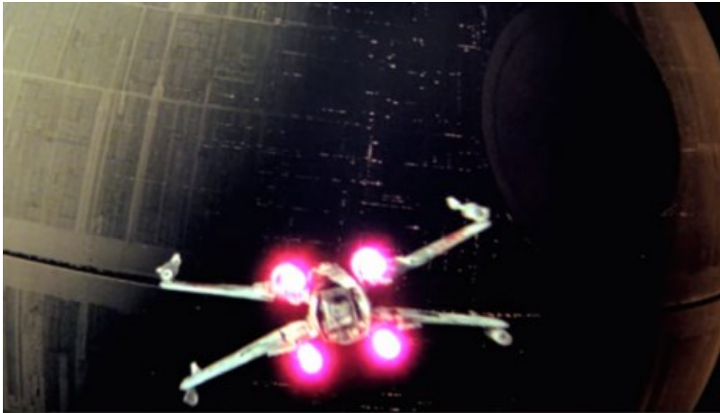
מלחמת הכוכבים (צילום מסך)

תהליך הריכוזיות בהוליווד היה חלק מכניסת קבוצות הון דומיננטיות לעסקי הסרטים. מדובר בשש קבוצות: קולומביה, דיסני, פרמאונט, פוקס המאה העשרים, וורנר-ברוס ווינברסל, שריכזו את רוב ההכנסות ושלטו בייצור ובהפצה. [10] תהליך הריכוזיות נוצר יחד עם עליית הביטחון היחסי בהשקעות ותחושת ירידה בסיכון הדיפרנציאלי של האולפנים המובילים. גם אסטרטגיות ההפצה השתנו ואפשרו את ירידת הסיכון והפיכת הציפיות להכנסות לאמינות יותר.