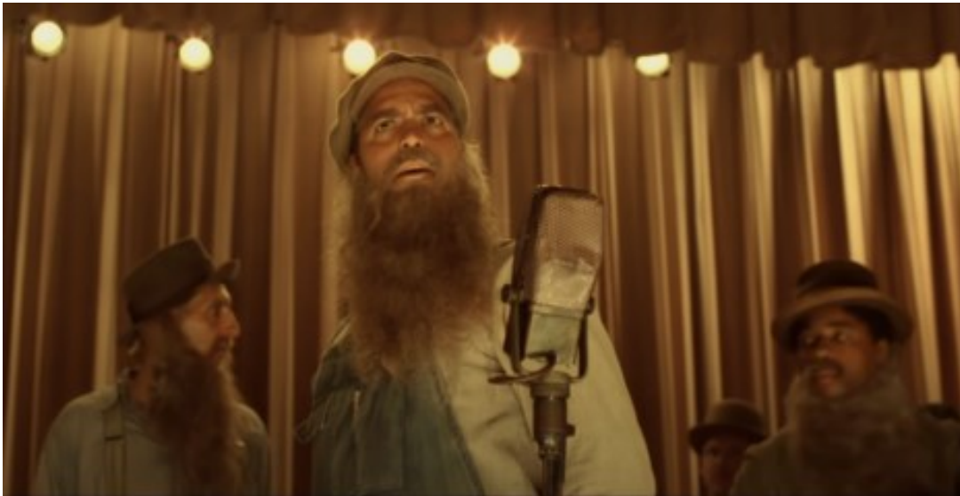
אחי, איפה אתה? (צילום מסך)

לעומת זאת קיימים סרטים מפתיעים, דלי תקציב, דלי תוכן, עם שחקנים אלמוניים כמו "רוקי", שקיבל מינימום הקרנות בפתיחה והפך במהירות לרווחי ביותר בין סרטי 1976, יותר מסרטים בעלי פריסה רחבה ותקציבי ענק כמו "התהום" ו"קינג קונג". כך גם "פלאטון" (1986), סרט "איכות", ביקורתי יחסית לאותה תקופה, עם עומק עלילתי מורכב, "גברי" וחסר דמות נשית. הסרט בעל דירוג הציפיות הנמוך להכנסות, שהוקרן בפתיחתו בששה (6) אולמות בלבד, הפך במהרה לשובר קופות, השלישי בהכנסותיו באותה שנה (כ-140 מיליון דולר על תקציב של 6 מיליון דולר).