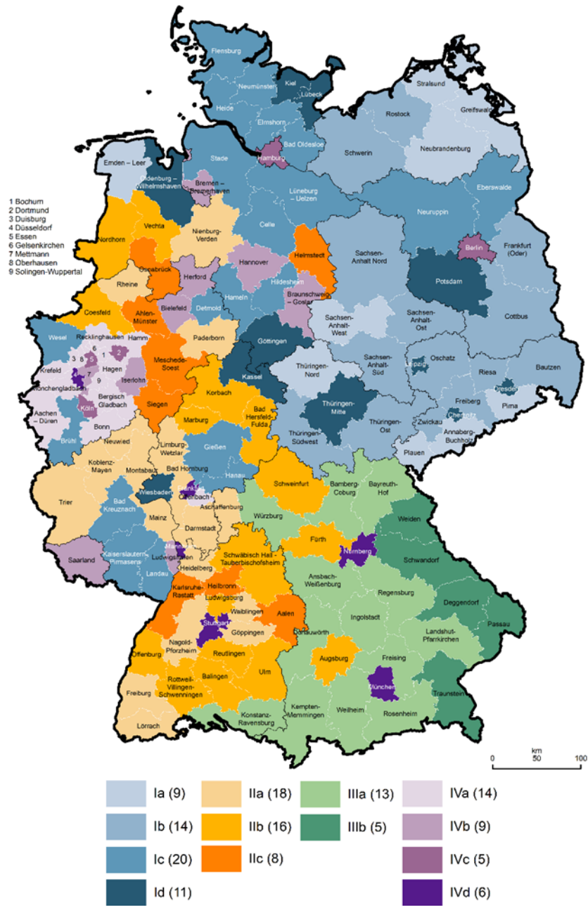
Abbildung 2: Vergleichstypen der Arbeitsagenturen