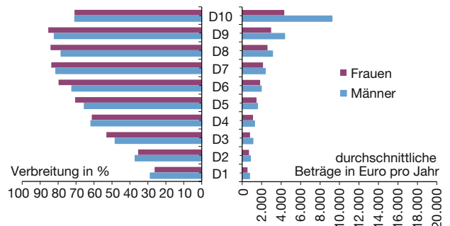
Abbildung 2 Sonderzahlungen in Ostdeutschland 2018 nach Dezilen der Bruttostundenlöhne

Gewichtete Anteile. Bezugsjahr 2018. Untersuchungspopulation: Alter von 18 bis einschließlich 65 Jahre, ohne Auszubildende und Beschäftigte in Altersteilzeit. Berlin ist Ostdeutschland zugeordnet. D1-D10: Dezile der Bruttostundenlohnverteilung.