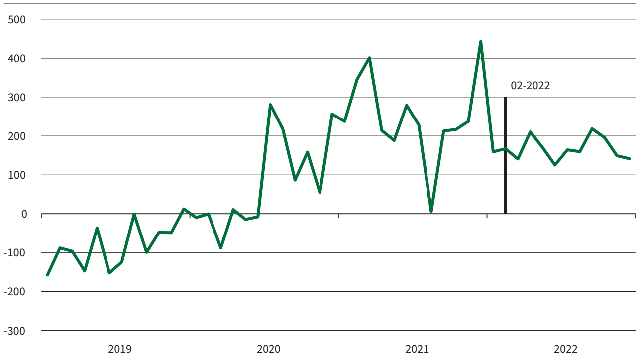
Abb. 3 Saldo der Gewerbeab- und -abmeldungen in Sachsen (saisonbereinigt)

Fügt man das Bild der Insolvenzen und der Gewerbeab- und -abmeldungen zusammen, wird deutlich, dass die Coronakrise, in Bezug auf die Anzahl der Unternehmen, gut bewältigt