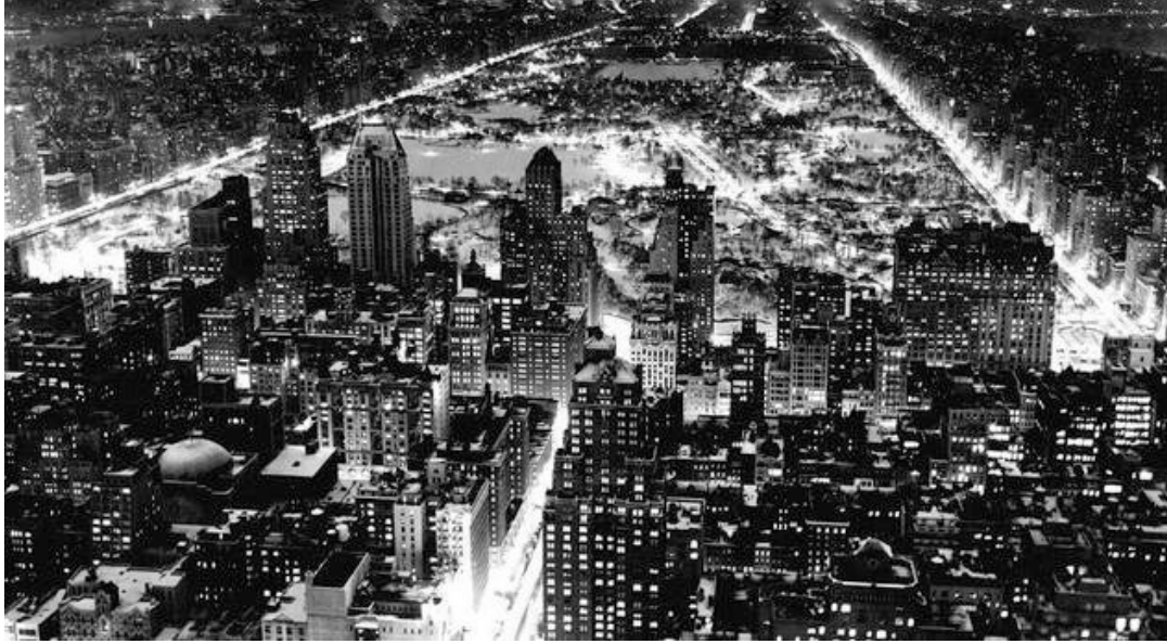
1920년대 뉴욕의 야경