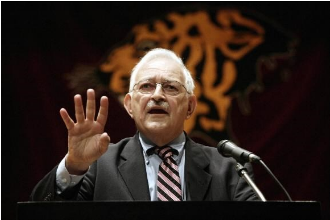
이매뉴얼 월러스틴(Immanuel Maurice Wallerstein)

새로운 대본에 따르면, ‘금융화(financialization)’는 더 이상 제국주의적 권력의 만병통치약이 아니다. 오히려 그것은 ‘가을의 징조(sign of autumn)’로서 제국주의적 쇠퇴의 주요 증거다(Braudel 1985, Vol. 3, 246).