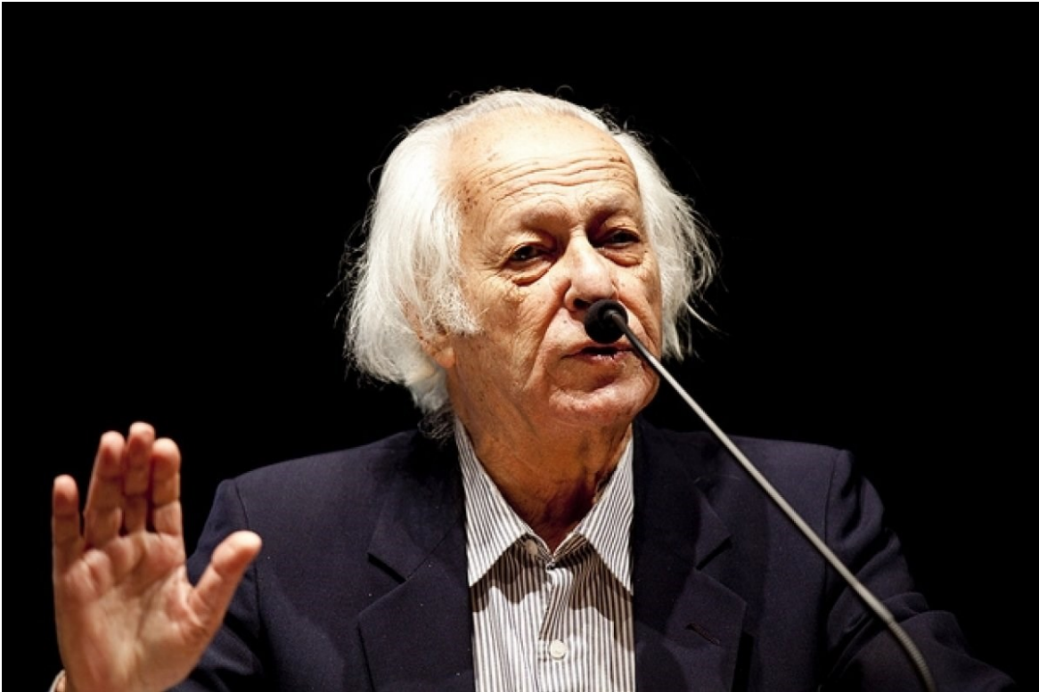
사미르 아민(Samir Amin)

그리고 우리가 종속이론의 시류에 빠르게 편승한 포스트주의자들을 믿는다면, 이 특정한 이론적 경향에서 특별히 놀랄 것은 없다. 결국 ‘역사’는 문명의 민족적-문화적 충돌, 즉 승자(자아, ego)가 자신의 문화를 패자(또 다른 자아, alter)에게 강요하는 제국주의적 패권의 끝없는 순환에 불과하다(전형적인 서사는 Hobson 2004를 참고하라). 육안으로 볼 때, 현대 세계의 총체적 자본화(the totalizing capitalization)는 독특한 역사적 과정처럼 보일 수 있다. 그러나 속지 마라. 이 명백한 독특성은 일시적인 것(a flash in the pan)이다. 그것을 해체해봐라. 그때 당신에게 남는 건 또 다른 제국주의적 강요(imperial imposition)다. 여기에선 나머지 세계에 대해 유럽-미국이 ‘금융화 담론(financialized discourse)’을 부과하는 걸 가리킨다.