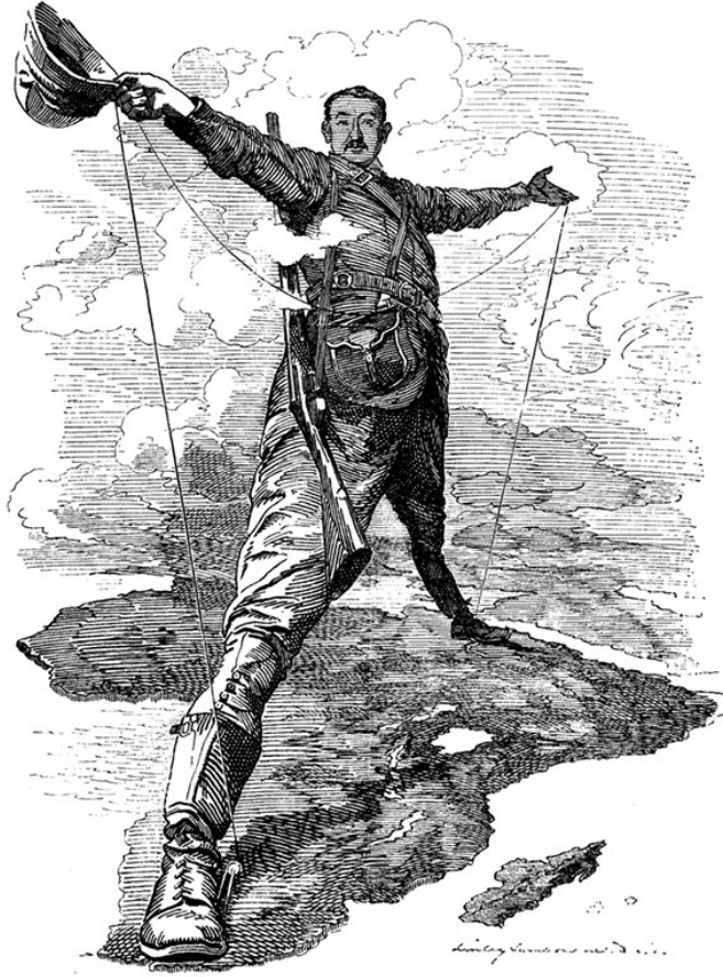
세실 로즈(Cecil Rhodes, 1853~1902)