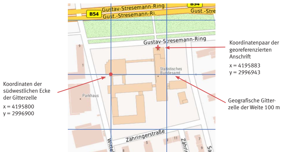
Grafik 1 Geokoordinatenpaar und 100 m x 100 m geografische Gitterzelle