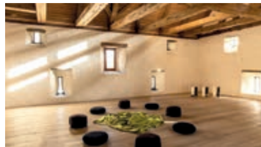
Die Propstei: Ein Ort zum Aufatmen – leben lieben lernen.

wieder allmählich Vertrauen gewinnen. Ist bei der katholischen Kirche der Markenkern, das Vertrauen in die Liebe Gottes, bei vielen Gläubigen nicht durch die Missbrauchsskandale der letzten Jahrzehnte unwiederbringlich zerstört worden?